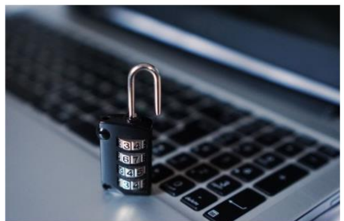
Publicado el Reglamento Europeo de CiberSeguridad