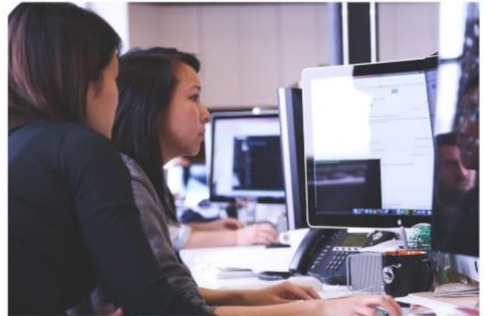
Tiempo de actualizar nuestros contratos de encargo de tratamiento