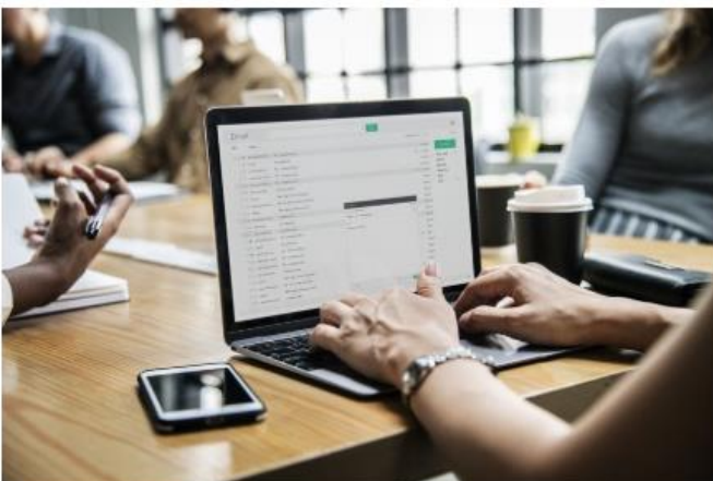
Primera sanción tras el RGPD en sector de recobro por falta de confidencialidad